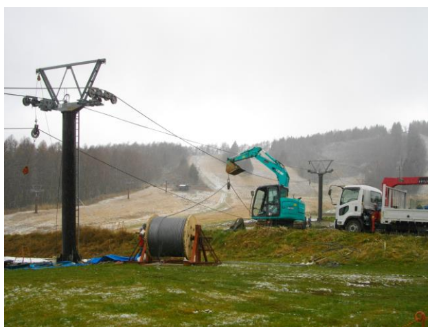
つばくろ第1ペアリフト索条交換整備

他、各リフトの摩耗した索輪の交換、ギヤオイル／作動油等の定期交換、支障木伐採等を実施いたしました。