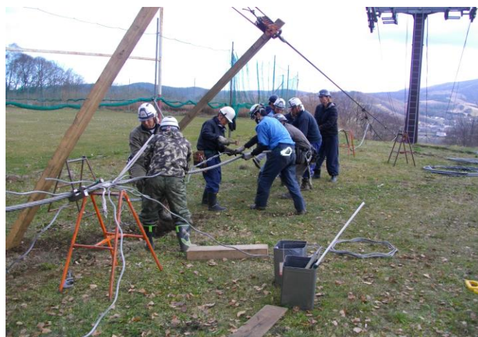
第1クワッド ワイヤーロープ交換

他、各リフトの摩耗した索輪の交換、ギヤオイル／作動油等の定期交換等を実施いたしました。