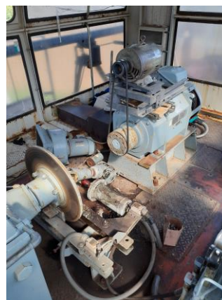
第3ペア モーター整流子研磨