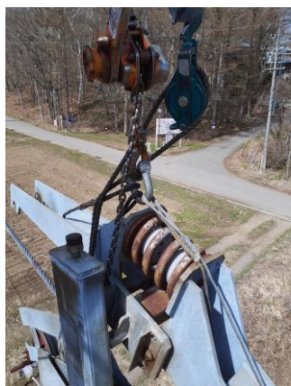
第6ペア 2FR ピン・ブッシュ交換

他、各リフトの摩耗した索輪の交換、ギヤオイル／作動油等の定期交換等を実施いたしました。